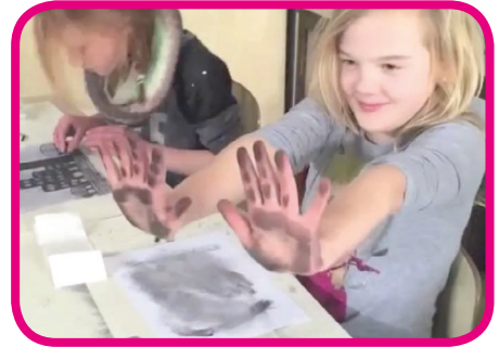
Bekijk de praktijk filmpjes op onze website

Met deze Kunstlessen worden de diverse technieken en verwerkingsmaterialen op een contextrijke (kunst gerelateerde) wijze ingezet. Een verrijking van handvaardigheid of het atelier programma van de school!